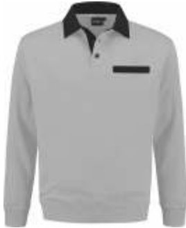
8070 Grijs - Zwart Grau - Schwarz Grey - Black Gris - Noir