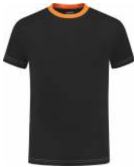
7040 Zwart - Oranje Schwarz - Orange Black - Orange Noir - Orange