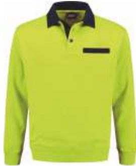
5010 Lime - Marine