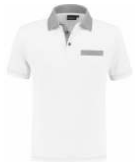
5580 Wit - Grijs Weiß - Grau White - Grey Blanc - Gris