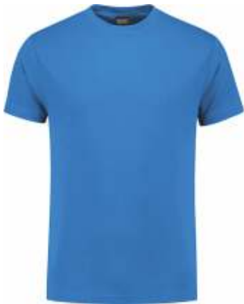
60 Korenblauw . Kornblumenblau . Cornflower Blue . Bleu Royal