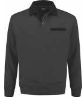
9070 Antraciet - Zwart Anthrazit - Schwarz Anthracite - Black Anthracite - Noir