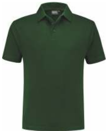
45 Groen . Grün . Green . Vert