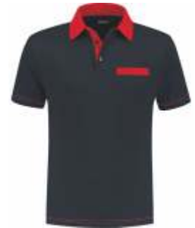
1020 Marine - Rood Marine - Rot Marine - Red Marine - Rouge