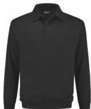
90 Antraciet . Anthrazit . Anthracite