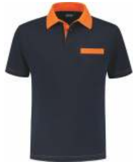
1040 Marine - Oranje Marine - Orange