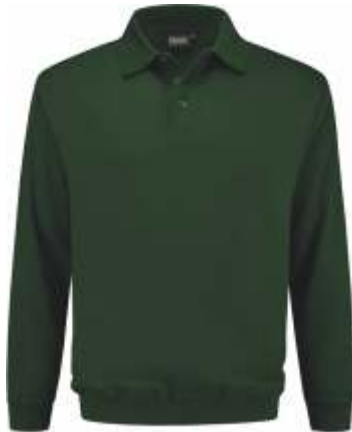
45 Groen . Grün . Green . Vert