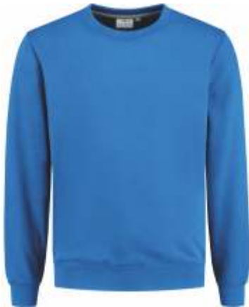
60 Korenblauw . Kornblumenblau . Cornflower Blue . Bleu Royal