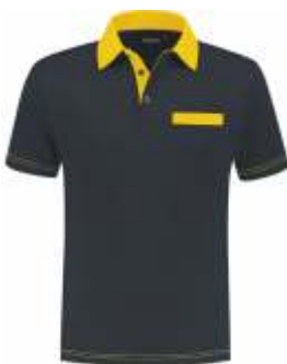
1030 Marine - Geel Marine - Gelb Marine - Yellow Marine - Jaune