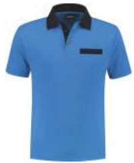
6010 Korenblauw - Marine Kornblumenblau - Marine Cornflower Blue - Marine Bleu Royal - Marine