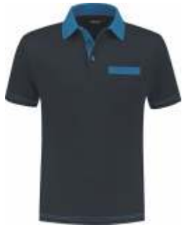
1060 Marine - Korenblauw Marine - Kornblumenblau Marine - Cornflower Blue Marine - Bleu Royal