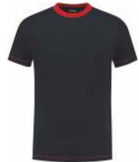
1020 Marine - Rood Marine - Rot Marine - Red Marine - Rouge