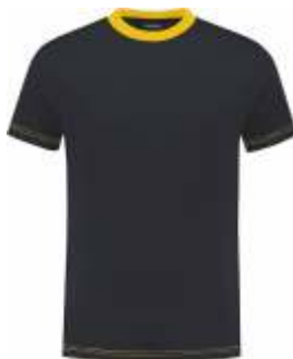
1030 Marine - Geel Marine - Gelb Marine - Yellow Marine - Jaune