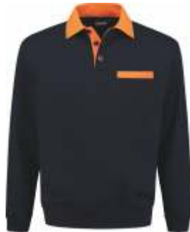
1040 Marine - Oranje Marine - Orange