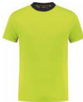
5010 Lime - Marine