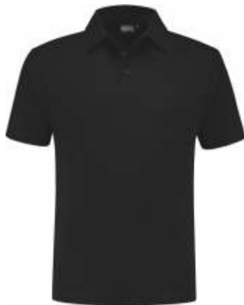
70 Zwart . Schwarz . Black . Noir