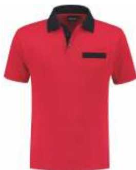
2010 Rood - Marine Rot - Marine Red - Marine Rouge - Marine