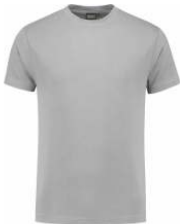
80 Grijs . Grau . Grey . Gris