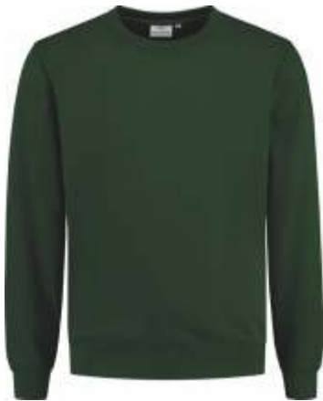
45 Groen . Grün . Green . Vert