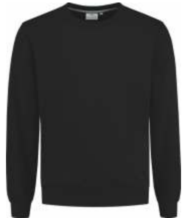
70 Zwart . Schwarz . Black . Noir