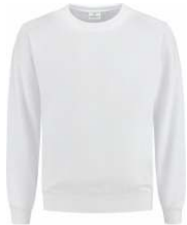
55 Wit . Weiß . White . Blanc