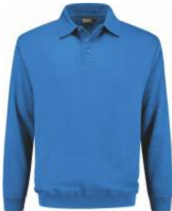
60 Korenblauw . Kornblumenblau . Cornflower Blue . Bleu Royal