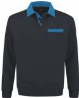
1060 Marine - Korenblauw Marine - Kornblumenblau Marine - Cornflower Blue Marine - Bleu Royal