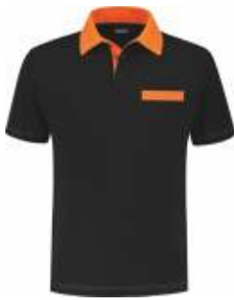
7040 Zwart - Oranje Schwarz - Orange Black - Orange Noir - Orange