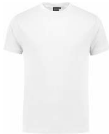
55 Wit . Weiß . White . Blanc