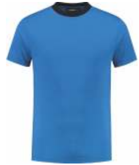
6010 Korenblauw - Marine Kornblumenblau - Marine Cornflower Blue - Marine Bleu Royal - Marine