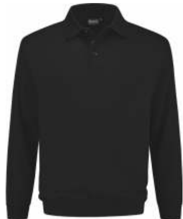
70 Zwart . Schwarz . Black . Noir