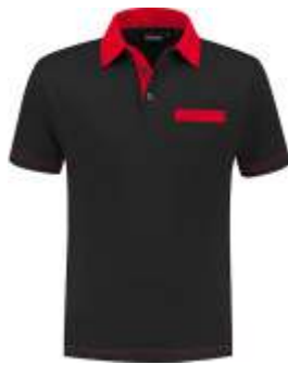
7020 Zwart - Rood Schwarz - Rot Black - Red Noir - Rouge