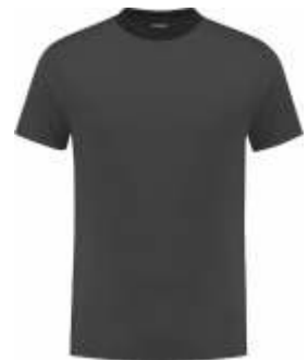
9070 Antraciet - Zwart Anthrazit - Schwarz Anthracite - Black Anthracite - Noir