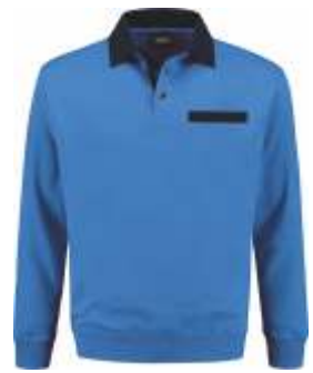
6010 Korenblauw - Marine Kornblumenblau - Marine Cornflower Blue - Marine Bleu Royal - Marine