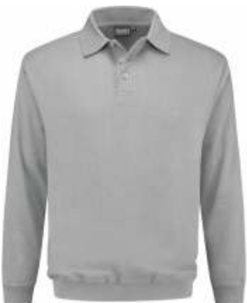
80 Grijs . Grau . Grey . Gris