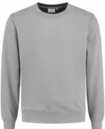
80 Grijs . Grau . Grey . Gris