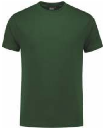
45 Groen . Grün . Green . Vert