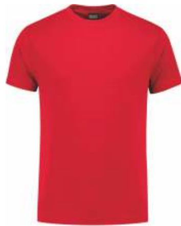
20 Rood . Rot . Red . Rouge