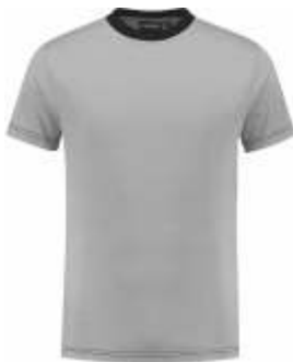
8070 Grijs - Zwart Grau - Schwarz Grey - Black Gris - Noir