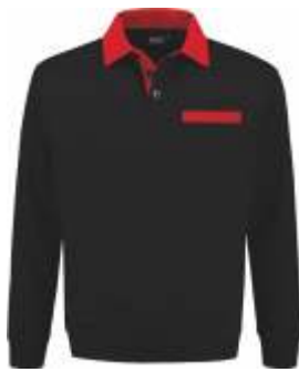
7020 Zwart - Rood Schwarz - Rot Black - Red Noir - Rouge