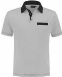
8070 Grijs - Zwart Grau - Schwarz Grey - Black Gris - Noir