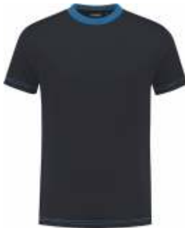
1060 Marine - Korenblauw Marine - Kornblumenblau Marine - Cornflower Blue Marine - Bleu Royal