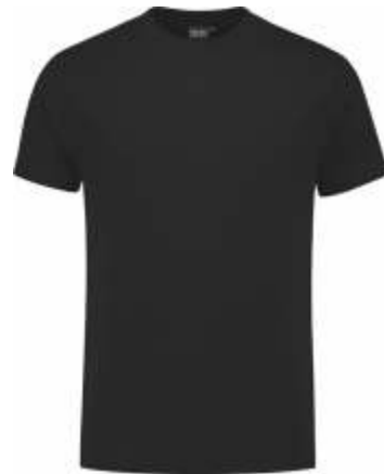
70 Zwart . Schwarz . Black . Noir