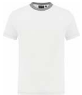
5580 Wit - Grijs Weiß - Grau White - Grey Blanc - Gris