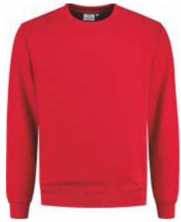
20 Rood . Rot . Red . Rouge