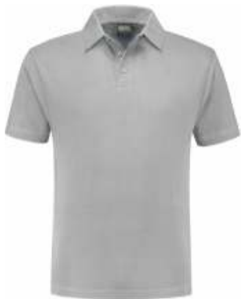
80 Grijs . Grau . Grey . Gris