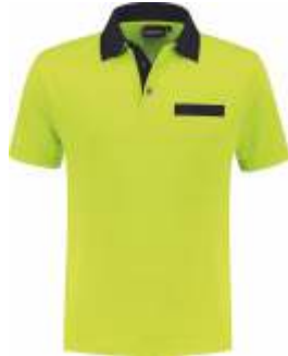
5010 Lime - Marine