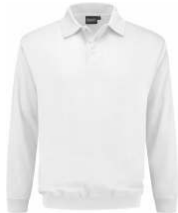
55 Wit . Weiß . White . Blanc