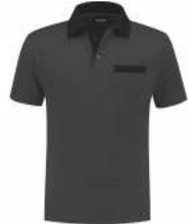
9070 Antraciet - Zwart Anthrazit - Schwarz Anthracite - Black Anthracite - Noir