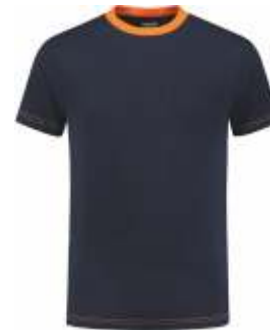
1040 Marine - Oranje Marine - Orange