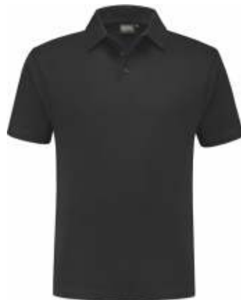
90 Antraciet . Anthrazit . Anthracite