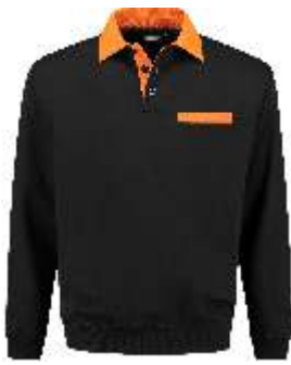
7040 Zwart - Oranje Schwarz - Orange Black - Orange Noir - Orange