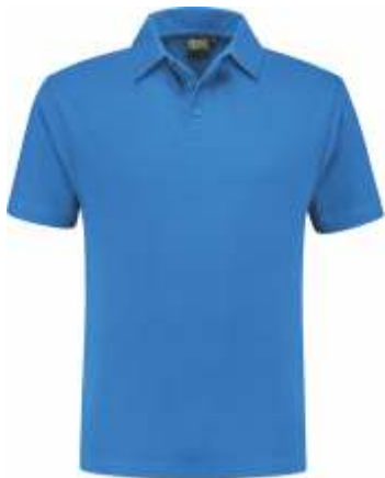
60 Korenblauw . Kornblumenblau . Cornflower Blue . Bleu Royal