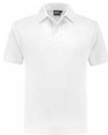
55 Wit . Weiß . White . Blanc