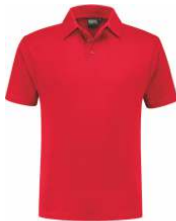
20 Rood . Rot . Red . Rouge