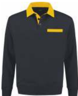
1030 Marine - Geel Marine - Gelb Marine - Yellow Marine - Jaune