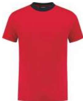
2010 Rood - Marine Rot - Marine Red - Marine Rouge - Marine