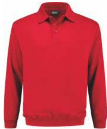
20 Rood . Rot . Red . Rouge