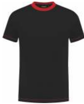
7020 Zwart - Rood Schwarz - Rot Black - Red Noir - Rouge