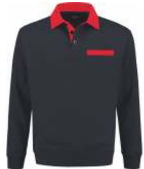
1020 Marine - Rood Marine - Rot Marine - Red Marine - Rouge